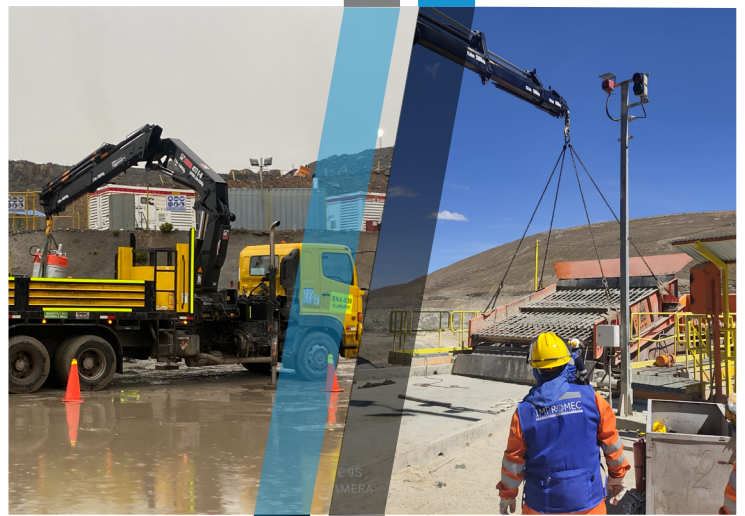
Termofusión y montaje de tubería HDPE