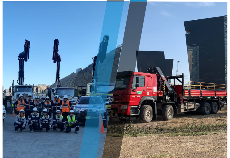
Ampliación de planta de flotación Minera VOLCAN