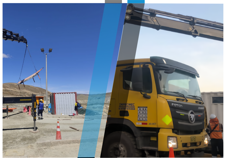
Montaje de ZARANDA SIMPLICITY Unidad Minera CERRO LINDO