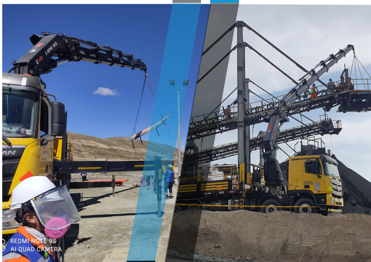
Traslado de Talleres Mviles de Mantenimiento