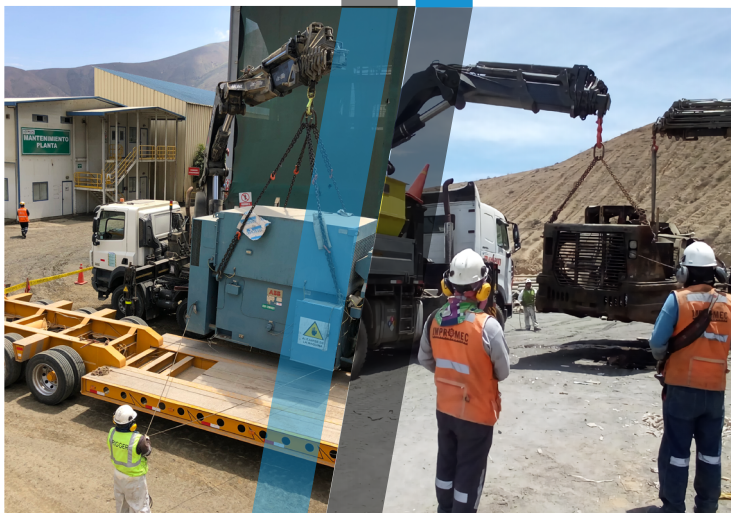
Montaje Electromecánico PANAMERICAN SILVER - HUARÓN