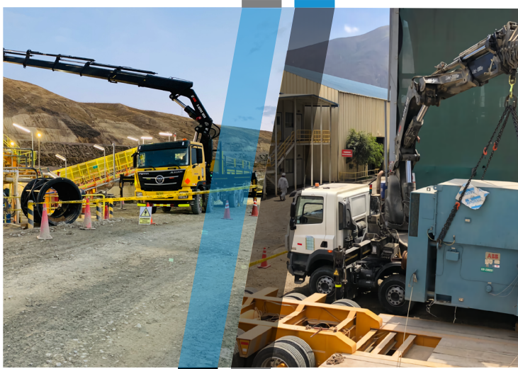
Montaje de tanque de almacenamiento Unidad Minera el PORVENIR