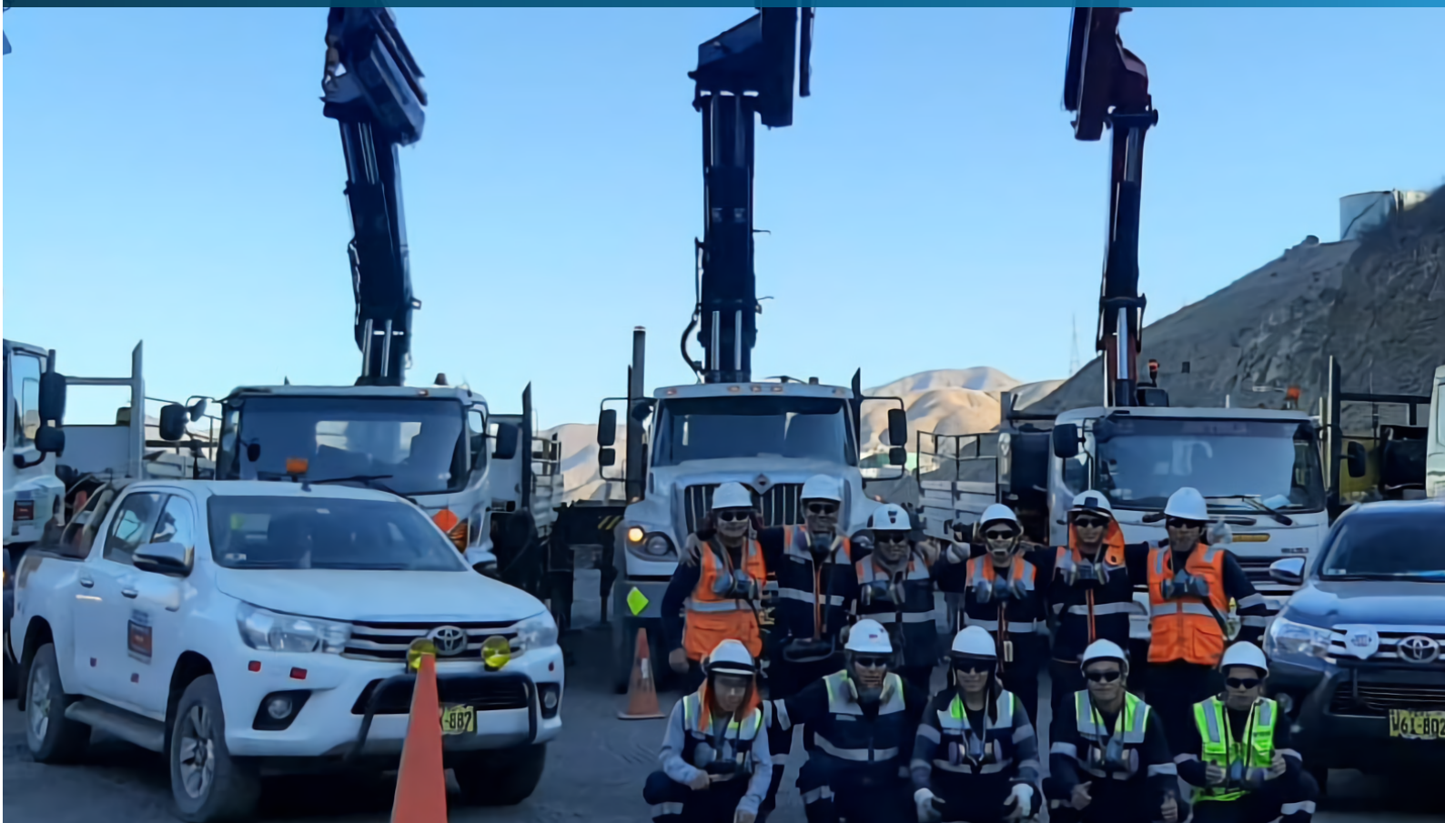
Camiones Grúa, Grúas articuladas, Camionetas.